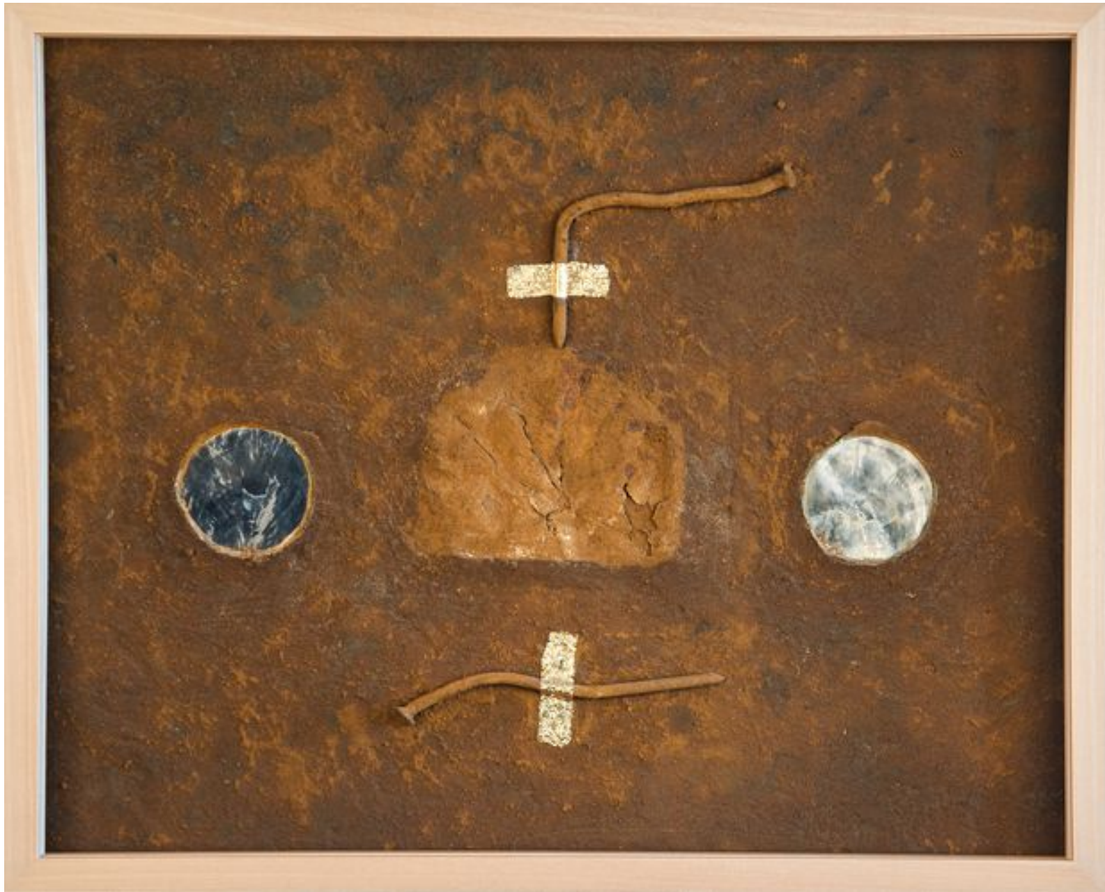
„CHRONOLOGISCHE UMPOLUNG“ 2015

Nägel, Muschelschalen, Metallplatte, Gold, Rost auf Karton – 40 x 50 cm