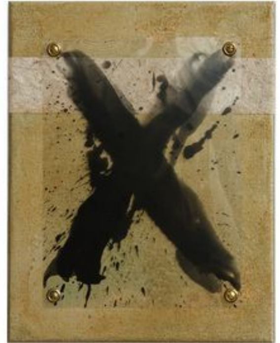
„CHEMOGRAMME – TRILOGIE“ 2015

S/W-Planfilm, Messingschrauben, Himalaya-Papier, Lackfarben auf Leinwand – 24 x 30 cm