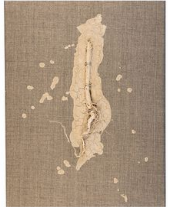
„VERWURZELTE CHRONOLOGIE“ 2015 Holz, Lehm, Nähgarn auf Leinwand – 30 x 40 cm