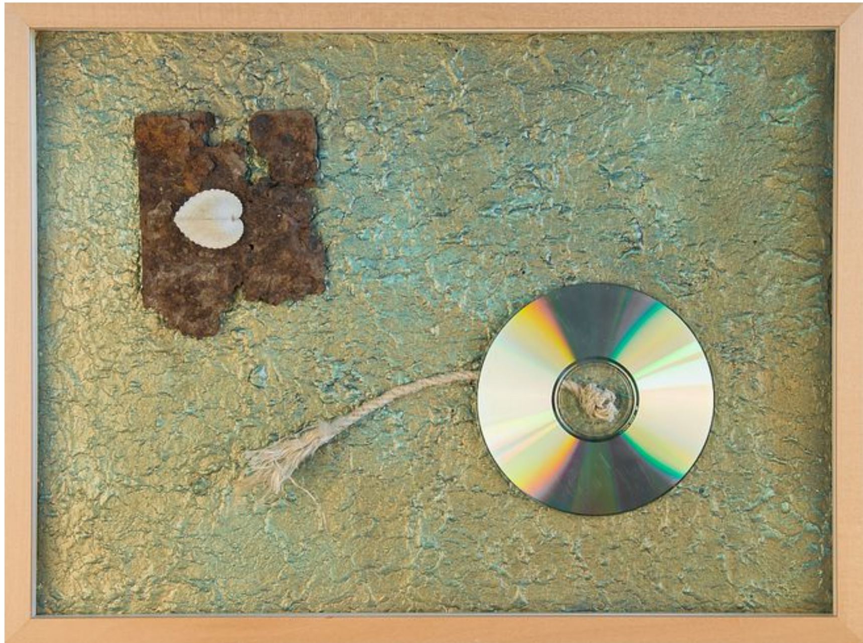
„DIGITALES STRANDGUT I“ 2015

Metallplatte, Muschel, CD, Seil, Lackfarbe auf Karton – 30 x 40 cm