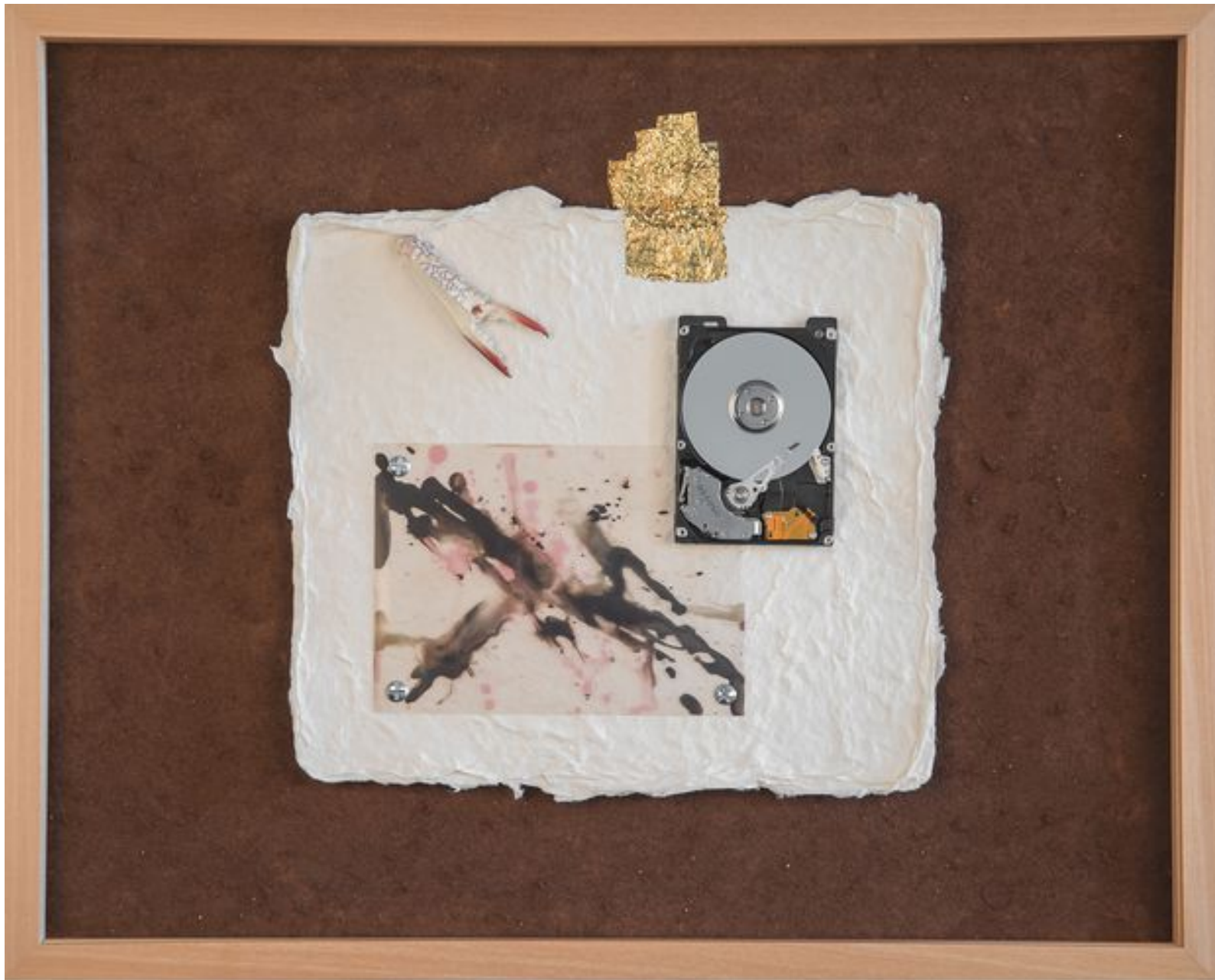
„ZUGRIFF VERWEIGERT“ 2015

Papier, Gold, Krepsschere, S/W-Planfilm, Schrauben, Computerfestplatte, Rost auf auf Karton - 40 x 50 cm